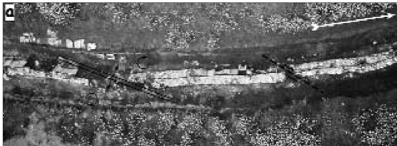
Fig. 2 - PARTICOLARE SETTORE DELLA CANALETTA ROMANA OVE SONO EVIDENTI LE DEFORMAZIONI CAUSATE DA EVENTI TETTONICI

Tale fattore geomorfologico, associato alle condizioni geomeccaniche dei terreni che lo costituiscono, ci induce a pensa-