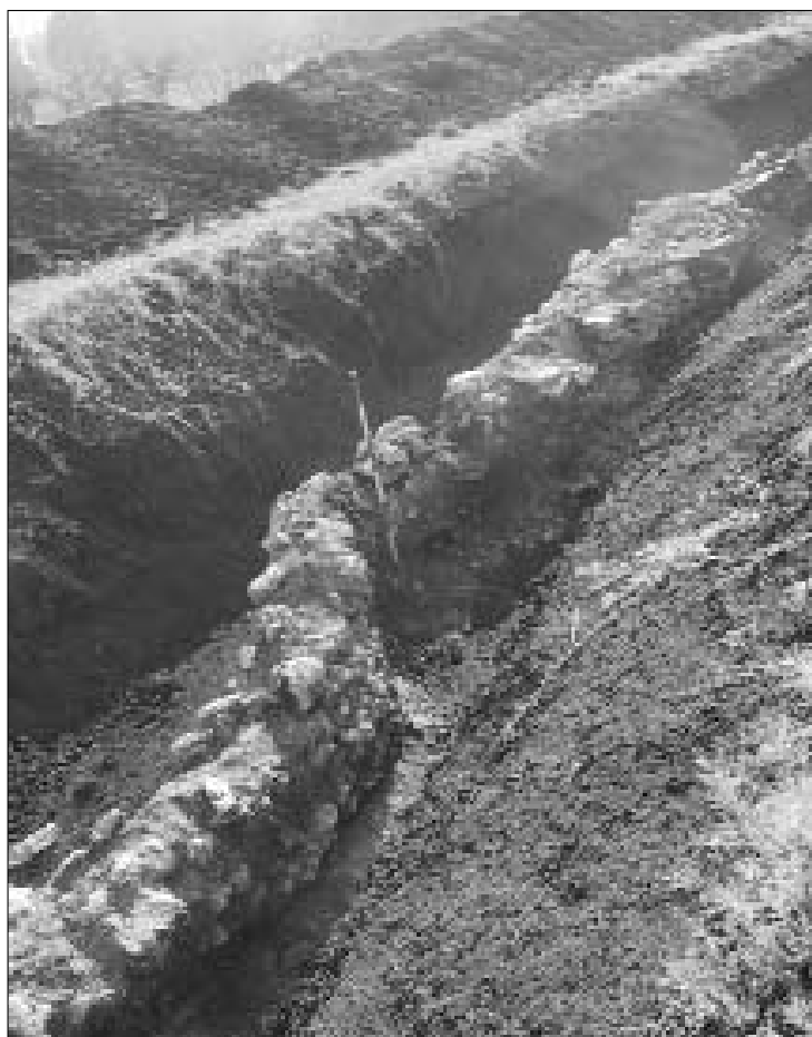
Fig. 1 - PARTICOLARE DEOFORMAZIONE DI UN TRATTO DELLA CANALETTA ROMANA

Non abbiamo sin ora informazioni certe riguardanti opere di canalizzazione che testimoniassero, già dall'epoca romana, che nella zona di Martellona ci fossero acque ricche in carbonato di calcio anche se ciò era assai probabile, viste le caratteristiche idrogeologiche della zona. Particolarmente interessante risulta essere dal punto di vista archeo-tettonico 6 il ritrovamento di una serie di opere idrauliche che avevano lo scopo di trasportare l'acqua sotterranea dalle pendici della collina denominata Tor de' Sordi per poi portarla in un insediamento più importante posto poco a valle. I suddetti manufatti si presentano realizzati con piedritti di struttura a concrezione e copertura displuviata alla cappuccina con tegole (Moscetti, 2001). Le acque che essi trasportavano erano certamente povere in car-