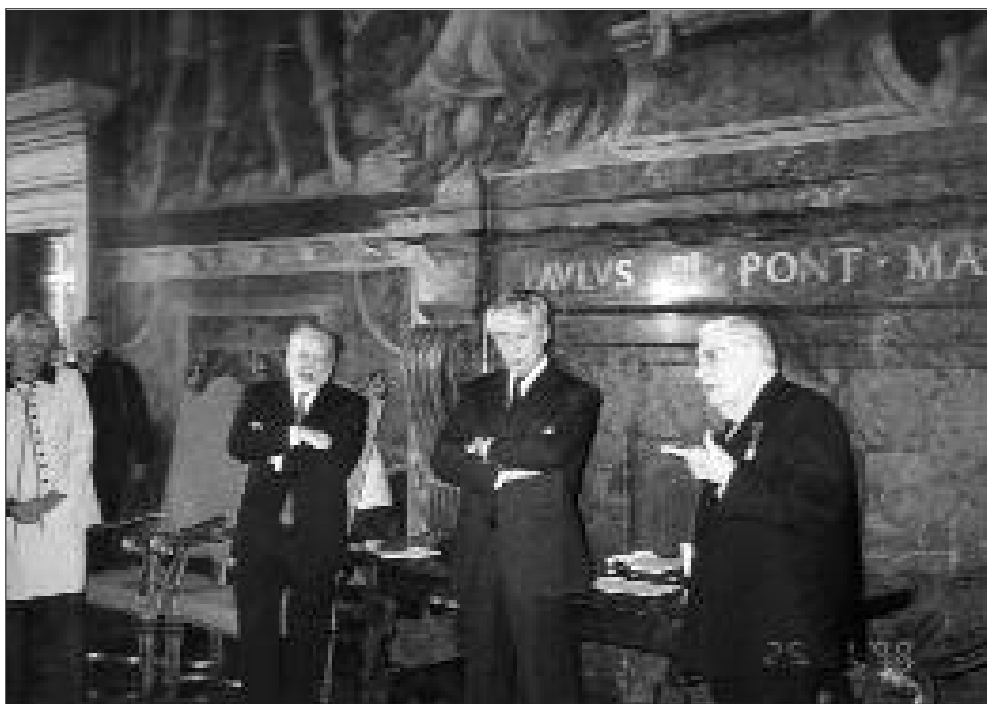
IL PROF. ZERI RINGRAZIA DOPO IL CONFERIMENTO DELLA "LEGION D'ONORE" PRESSO L'AMBASCIATA DI FRANCIA A ROMA

C'è un quadro a Dublino molto importante, nella Galleria Nazionale, che io ho identificato come un quadro siciliano; lì passa non mi ricordo per un quadro spagnolo, mentre è un quadro siciliano: il primo tempo del Novelli, nel quale c'è un miracolo di un santo con un bambino vicino ad una vasca in cui ci sono dei pesci. Io ho passato mesi alla ricerca del significato di quel quadro, perché m'interessa personalmente. Che cosa sia, non lo so dire, però è sempre meglio continuare le ricerche, anche per curiosità.