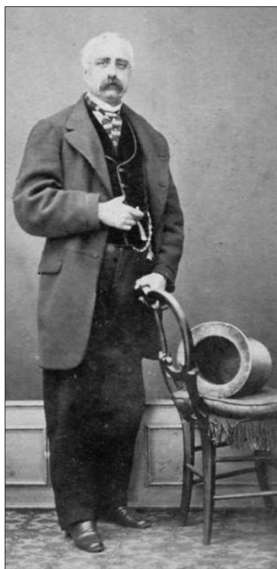
Fig. 3 - FRANCESCO ANCA, BARONE DI MANGALAVITI

La fauna fu determinata da Anca tra il 1860 e il 1867 e da allora tutti gli Autori che successivamente si sono occupati della grotta, si sono limitati a riportare il primo elenco aggiungendo qualche elemento.