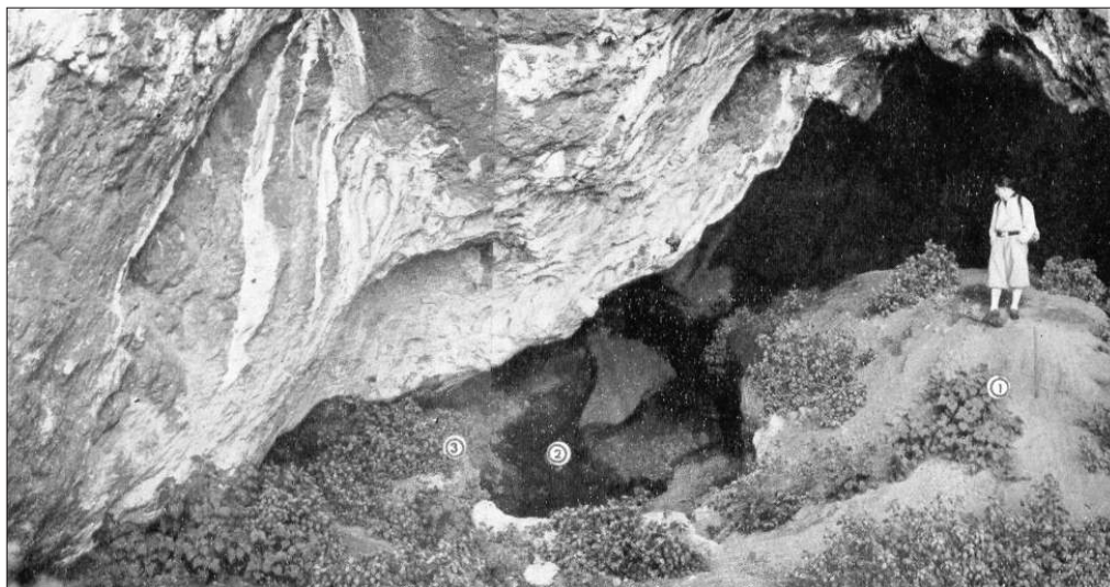
Fig. 2 – L’INGRESSO DELLA GROTTA DI SAN TEODORO NEL 1937

La grotta di S. Teodoro è nota agli studiosi sin dal 1859 anno in cui Francesco Anca, barone di Mangalaviti, la scoprì ed effettuò i primi scavi, rinvenendo al suo interno numerosi resti fossili di mammiferi fra i quali resti di carnivori mai trovati nelle poche grotte siciliane fino ad allora note. Con l’aiuto dello studioso francese Édouard Lartet, Anca determinò la fauna fossile presente nella grotta. Uomo eclettico e grande patriota, Anca effettuò uno scavo all’interno della grotta rinvenendo due orizzonti ben distinti: nell’orizzonte inferiore si trovava un deposito a mammiferi estinti, in quello superiore, oltre ai resti di specie utili all’alimentazione dell’uomo, una innumerevole quantità di armi in pietra che lo portarono a concludere che la grotta di San Teodoro fosse stata una stazione umana permanente... La disposizione, la profondità, l’ampiezza, la inflessione, ed i luoghi reconditi di questa grotta potrebbero farla ritenere come una vera stazione umana permanente, dando il locale l’agiatezza di stare al coperto dagli agenti atmosferici, ed apprestando l’agevolezza di procurarsi il vitto colla caccia nei soprastanti boschi, e colla pesca nel prossimo mare; oltreché avrebbero