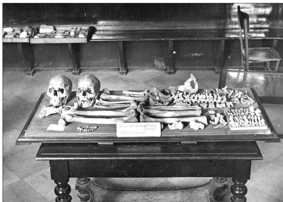
Fig. 4 - I REPERTI UMANI FOTOGRAFATI ALL'EPOCA DEL RITROVAMENTO