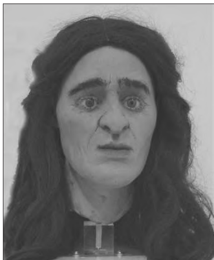
Fig. 1 – RICOSTRUZIONE DEL VOLTO DI “THEA”

me, altre leggende narrano che la grotta fosse abitata dall’eremita Teodoro. In seguito gli abitanti del vicino paese vi eressero un santuario protetto da quel muro che sbarrava l’ingresso. Successivamente la grotta fu adibita ad ovile, oltre ad essere stata sicuro rifugio per gli abitanti del luogo durante gli eventi bellici.