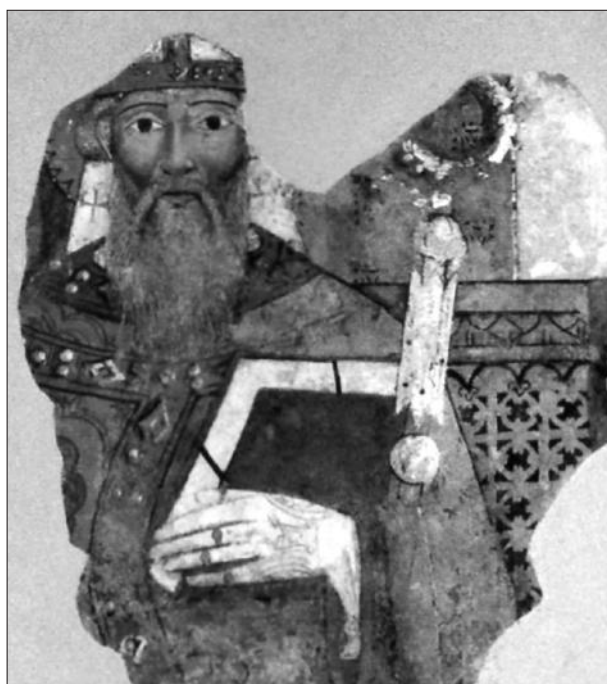
UN AFFRESCO DEL MUSEO DELLA CULTURA E DELLE ARTI FIGURATIVE BIZANTINE E NORMANNE: SAN BASILIO